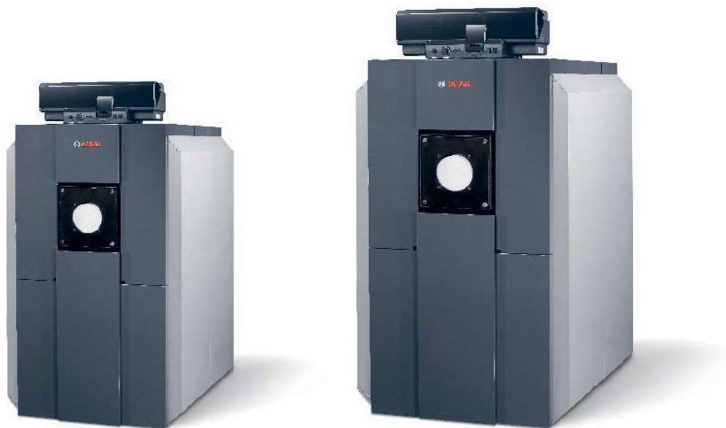
Bosch Uni Condens UC8000F, in verschiedenen Baugrößen erhältlich