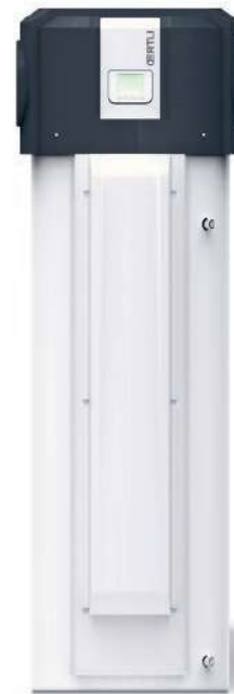
Oertli TWH 300

Neue wissenschaftliche Erkenntnisse, politische Tendenzen, technologische Fortschritte sowie permanent aktualisierte Gesetze und Vorschriften werden in Zukunft immer stärker Einfluss auf die Wärmeproduktion nehmen. Insbesondere im Zusammenhang mit der Nutzung fossiler Brennstoffe sind neue Möglichkeiten zur Kombination mit regenerativen Energiequellen gefordert. Meier Tobler ist dafür schon heute bestens gerüstet.